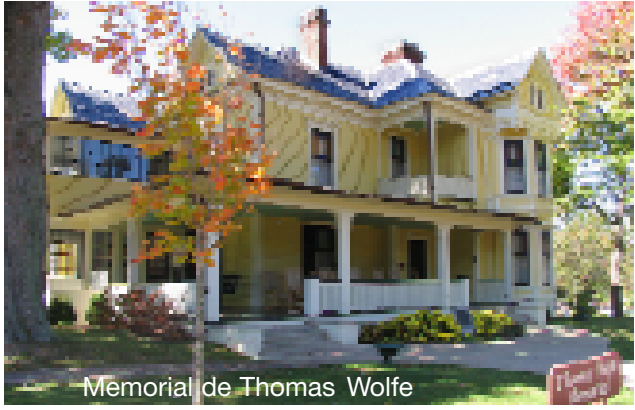
Memorial de Thomas Wolfe