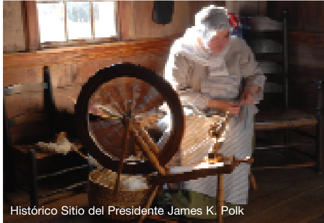
Histórico Sitio del Presidente James K. Polk