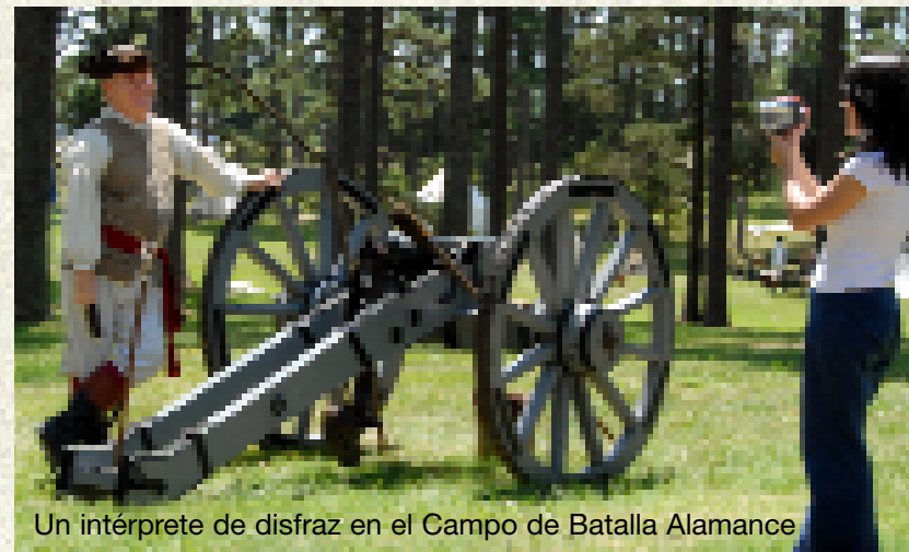
Un intérprete de disfraz en el Campo de Batalla Alamance

La historia colonial y revolucionaria de Carolina del Norte es emocionante y única, tranquila y violenta. El Parque del Festival de la Isla Roanoke celebra el primer poblado inglés de América. Pueblos coloniales pintorescos como Edenton, Bath, y Halifax estaban esparcidos en los paisajes del estado. Durante la Guerra de los Franceses y los Indios, los primeros colonos buscaban refugio en Fuerte Dobbs. "El Palacio de Tryon" se convirtió en un símbolo de la corrupción británica, llevándose la Batalla de Alamance. Y la Casa en el Herradura lleva las cicatrices de una escaramuza de la Guerra Revolucionaria.