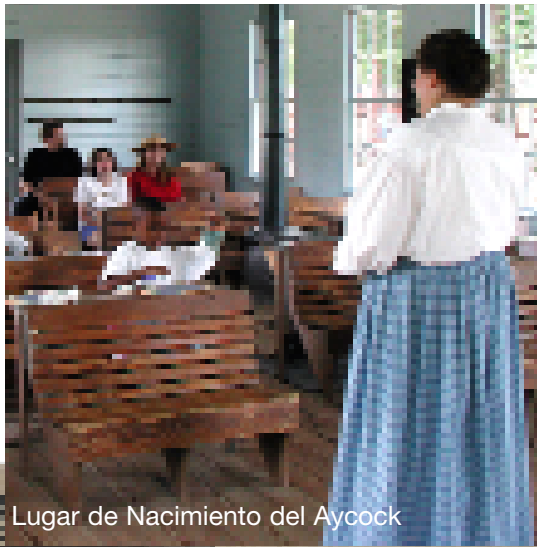
Lugar de Nacimiento del Aycock