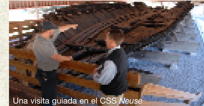
Una visita guiada en el CSS Neuse

Carolina del Norte ha producido individuos quienes han sido creativos y aventureros, llenos de ánimo y controvertidos. Richard Caswell se convirtió en un héroe de la Guerra Revolucionaria y fue el primer gobernador del estado. Thomas Wolfe escribió sobre la vida en la casa de huéspedes Victoriana de su madre, la Vieja Casa de Kentucky. James K. Polk creció de una finca del Condado Mecklenburg para hacerse el onceavo presidente de la nación. Y gobernadores Vance y Aycock, juntos con muchos otros líderes, sirvieron en el majestuoso Capitolio del Estado.