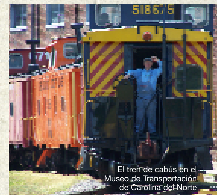
El tren de cabús en el Museo de Transportación de Carolina del Norte

Grupos deberían llamar por adelantado para programar visitas guiadas. Horas de operación puede variar de un sitio a otro. Por favor llame para más información o visite nuestra página web en: www.nchistoricsites.org