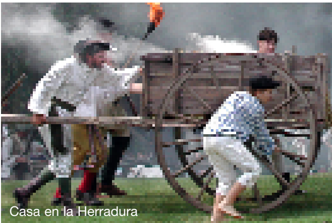
Casa en la Herradura