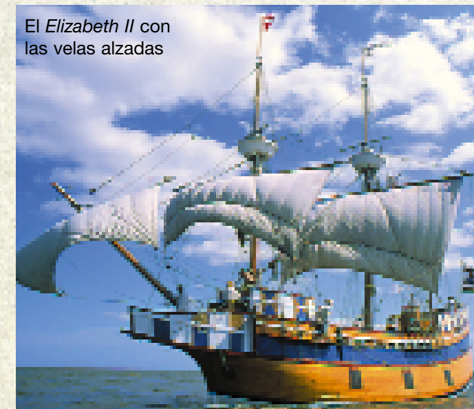
El Elizabeth II con las velas alzadas