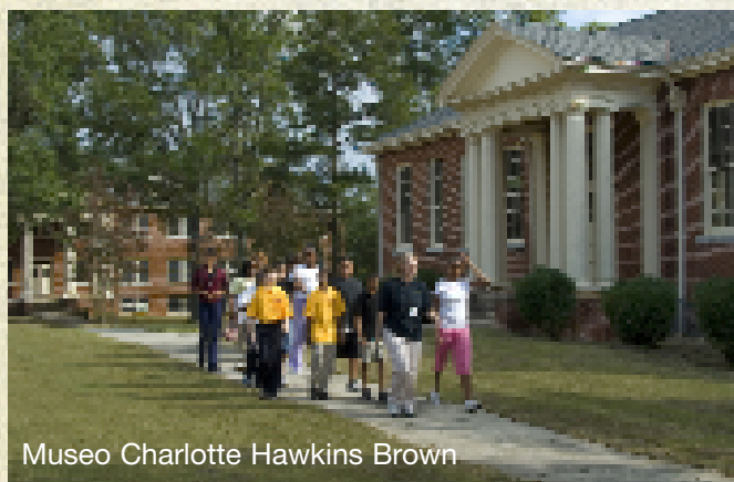
Museo Charlotte Hawkins Brown

Sitios relacionados a Historia Afro-Americana son: • Museo Charlotte Hawkins Brown • Histórico Edenton • Histórico Halifax • Histórico Stagville • Mina de Oro Reed • Parque del Festival de la Isla Roanoke • Lugar Somerset • Históricos Sitios y Jardines del Palacio de Tryon