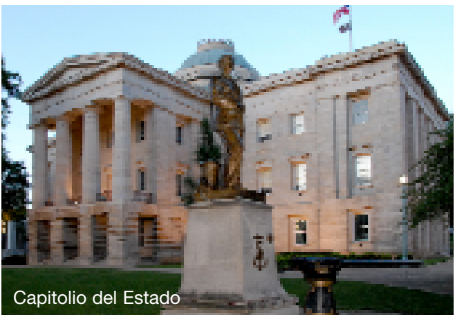
Capitolio del Estado