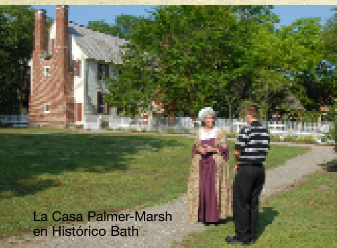
La Casa Palmer-Marsh en Histórico Bath

Sitios relacionados a la historia de mujeres son: • Museo Charlotte Hawkins Brown • Lugar de Nacimiento del Gobernador Charles B. Aycock • Histórico Edenton • Finca Horne Creek • Casa en la Herradura • Histórico Sitio del Pres. James K. Polk • Lugar Somerset • Memorial de Thomas Wolfe