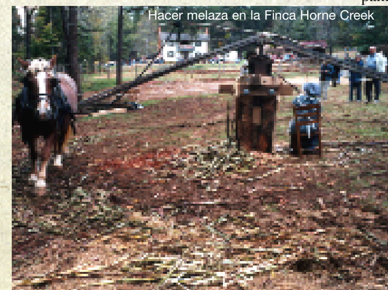
Hacer melaza en la Finca Horne Creek