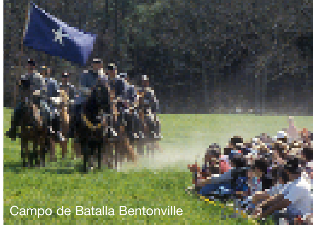
Campo de Batalla Bentonville