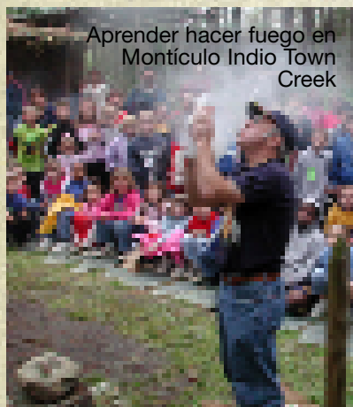
Aprender hacer fuego en Montículo Indio Town Creek

Sitios relacionados a historia India Americana son: • Fuerte Dobbs • Histórico Bath • Parque del Festival de la Isla Roanoke • Montículo Indio Town Creek