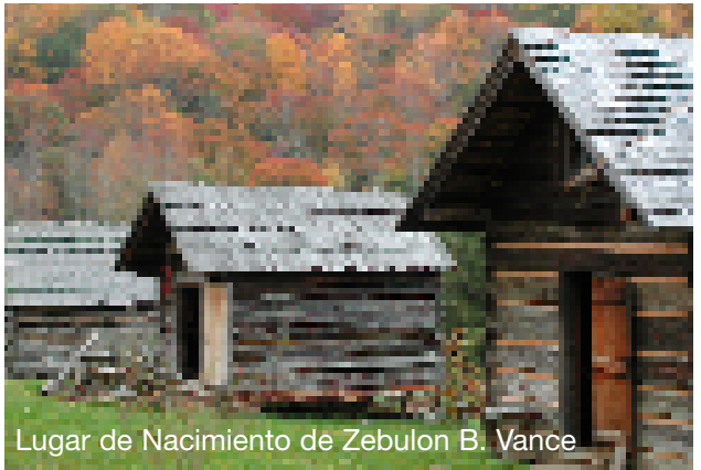
Lugar de Nacimiento de Zebulon B. Vance