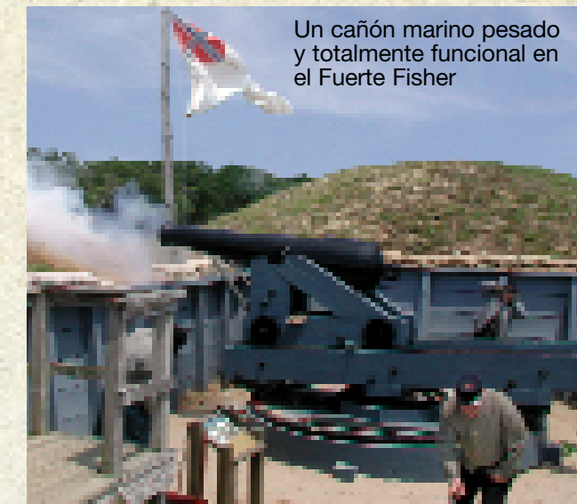
Un cañón marino pesado y totalmente funcional en el Fuerte Fisher