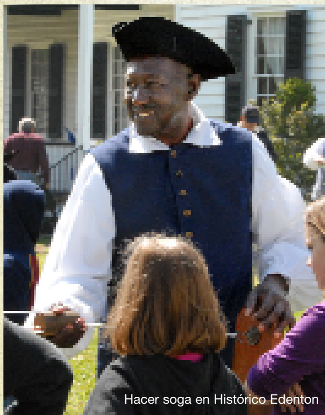
Hacer soga en Histórico Edenton