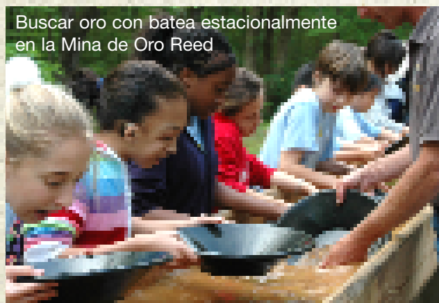
Buscar oro con batea estacionalmente en la Mina de Oro Reed

• Montículo Indio Town Creek • Históricos Sitios y Jardines del Palacio de Tryon