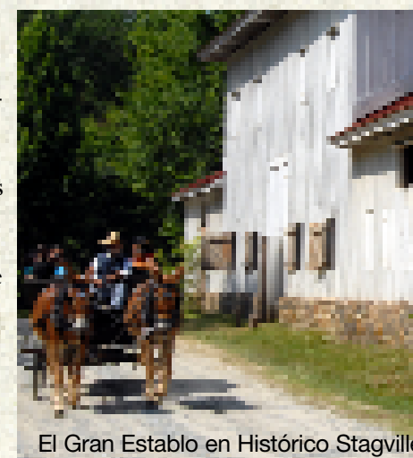
El Gran Establo en Histórico Stagville