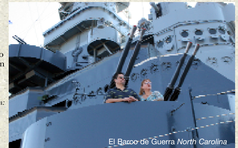
El Barco de Guerra North Carolina