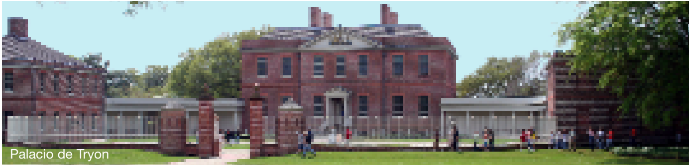
Palacio de Tryon